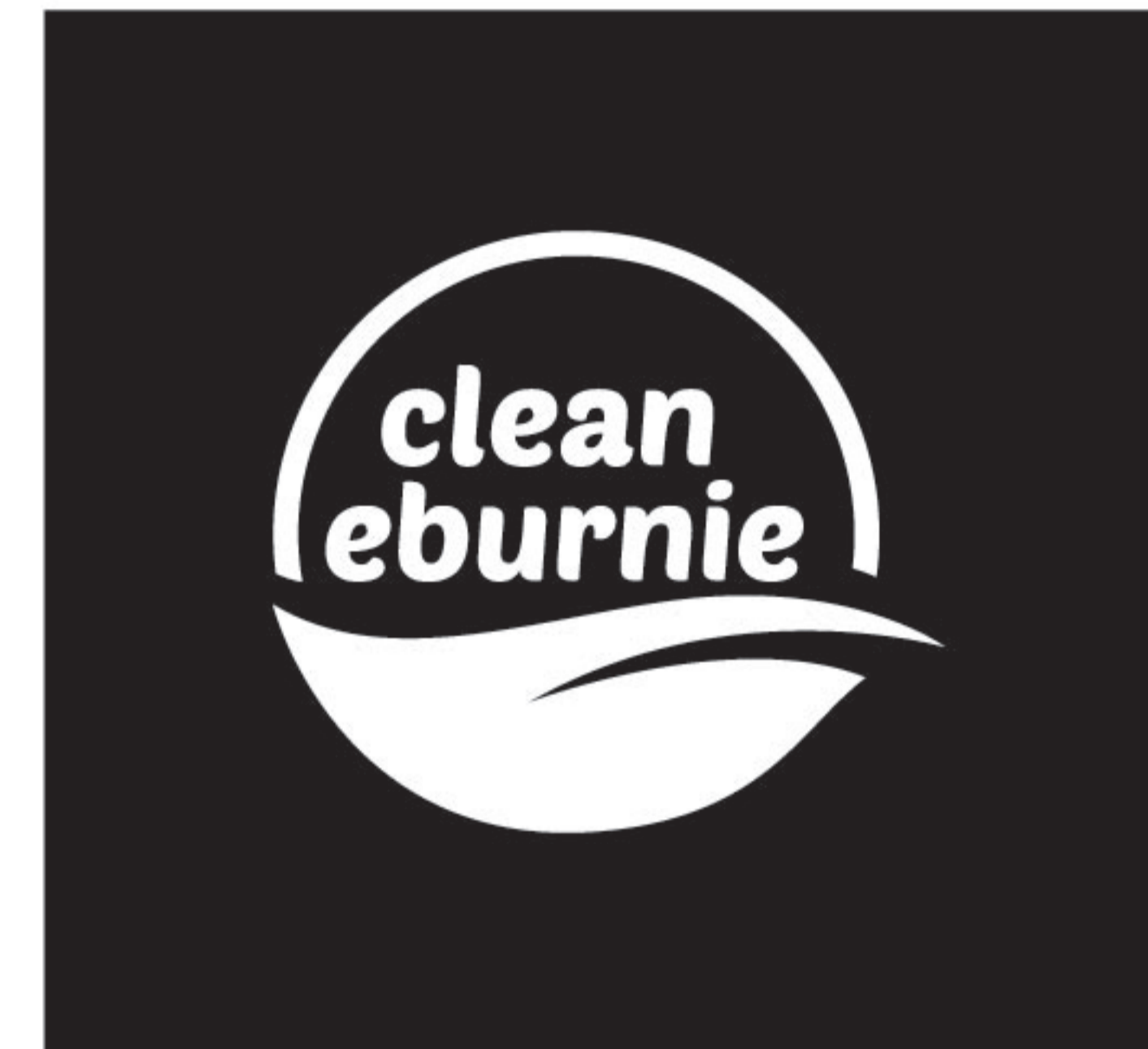
version négative monochrome