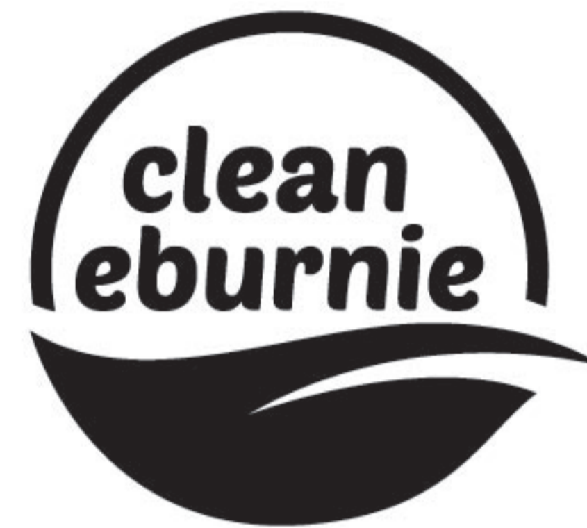
version positive monochrome